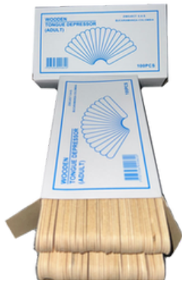
Caja a Granel