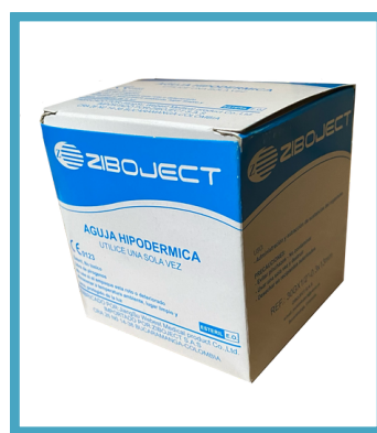
Foto de referencia del producto