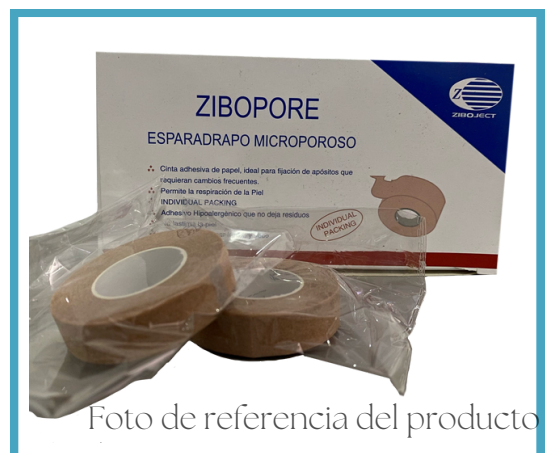
Foto de referencia del producto