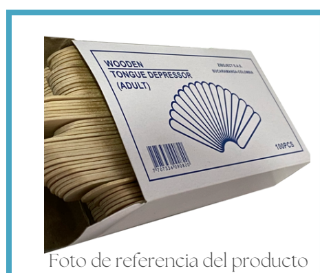
Foto de referencia del producto