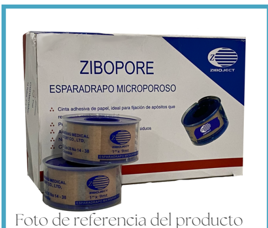
Foto de referencia del producto