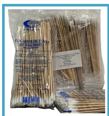
Foto de referencia del producto