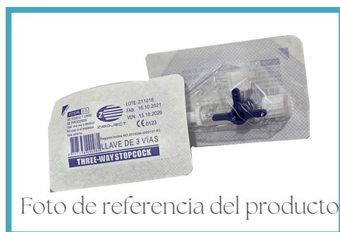
Foto de referencia del producto