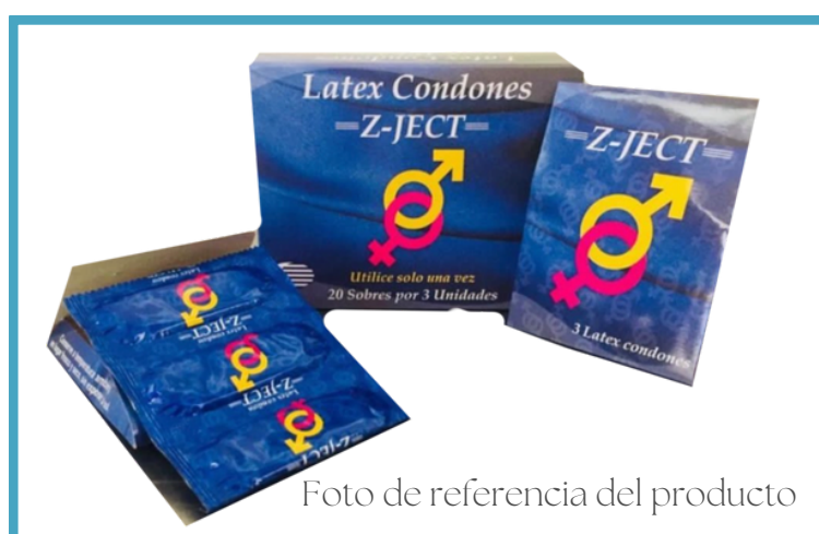
Foto de referencia del producto