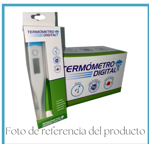
Foto de referencia del producto